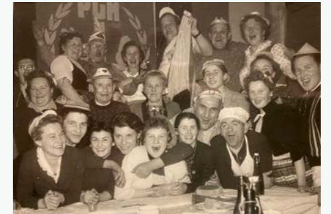
Feier in der PGH-Bau. Ein Teil des Gewinns war für Kulturveranstaltungen reserviert.

Den siebenköpfigen Vorstand der PGH bildeten Mitte der 1960er Jahre vier Parteiloze, nur ein Mitglied der SED und zwei der nationaldemokratischen Blockpartei (NDPD), der auch der