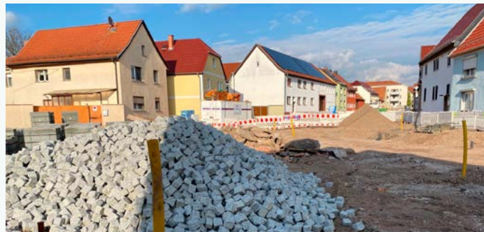
Das Material für den Endsprint in der Sackgasse liegt bereit.

Die Erdkabel sowie Leerrohre für Glasfaser sind verlegt und die Haushalte stromtechnisch erfolgreich umgebunden. Auch die Trinkwasserhauptleitungen wurden vollständig erneuert. Im April konnte der Mischwasserkanal mit sämtlichen den letzten Hausanschlüssen fertiggestellt werden.