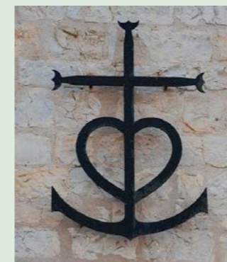
Foto: Kreuz der Camargue an der Fassade der Kirche Notre-Dame, Saintes-Maries-de-la-Mer (Wikipedia)

Vor einiger Zeit waren wir mit Freunden für ein Wochenende mit dem Hausboot auf den Seen der Havel unterwegs. Wenn wir Pausen machten oder einen Schlafplatz suchten, mussten wir ankern. Das war gar nicht so leicht, denn die Leine war lang und der Anker ziemlich schwer. Er musste mit Schwung tief auf den Grund des Sees befördert werden. Aber als es geschafft war, haben wir uns sicher gefühlt: Sicher, um auf dem Wasser zu schlafen. Sicher vor aufkommendem Wind und Wellen. Wie wichtig muss dann erst ein Anker für ein Schiff mitten im Sturm sein.